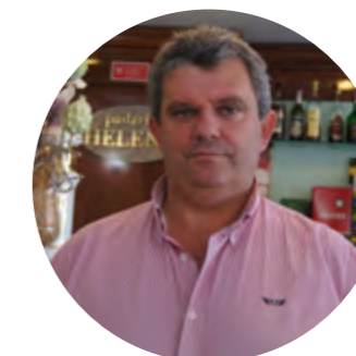
António Heleno Pastelaria-Padaria Heleno

Os bons já estão empregados. Tudo o que é de novo, malta jovem, tem outra visão e sabe melhorar e inovar, que é o que este país precisa, e apostar neste ramo é muito importante porque realmente há falta de mão-de-obra especializada.