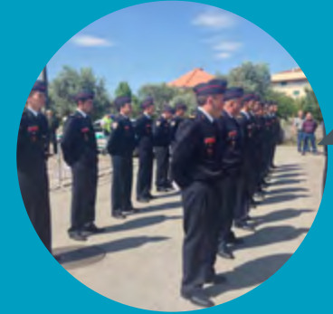
XXX Aniversário da Secção de Freixianda, dos Bombeiros Voluntários de Ourém

Pelo empenhamento e sucesso da iniciativa, muitos parabéns a todos quantos nela participaram!