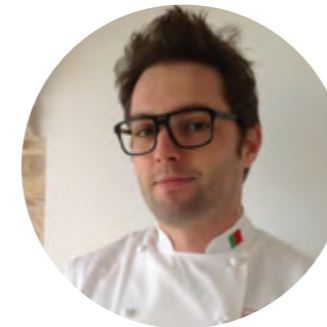
José Heleno Pastelaria Milano

O curso profissional de Pastelaria/Padaria é orientado para jovens que concluíram o 9º ano de escolaridade, com idade compreendida entre os 16 e os 20 anos e que demonstrem vocação e competências mínimas para frequentar com sucesso esta área de formação, que apresenta um elevado nível de complexidade técnica, mas que garante um percurso profissional de garantido sucesso. As inscrições podem ser feitas através do site www.insignare.pt ou diretamente na Secretaria da Escola, até ao próximo dia 30 de junho.