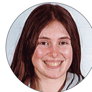
Mariana Francisco Curso de Cozinha/Pastelaria | 18.21B

O nosso “Carmelito” é um pastel que é constituído por uma massa feita de farinha de trigo, manteiga, açúcar e ovos e pelo recheio composto por doce de abóbora, casca de limão, ovos, açúcar, farinha de amêndoa e por fim açúcar em pó para polvilhar e canela em pó para o símbolo da Rota Carmelita.”